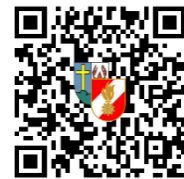
FF Pram Einsätze