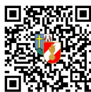
Video FF Ball