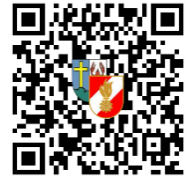
FF Pram Einsätze

Im Einsatz standen 45 Kameraden unserer Wehr. Die Einsatzbereitschaft konnte um 20:00 Uhr wieder hergestellt werden.